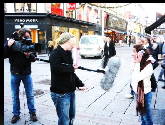
EMW i media