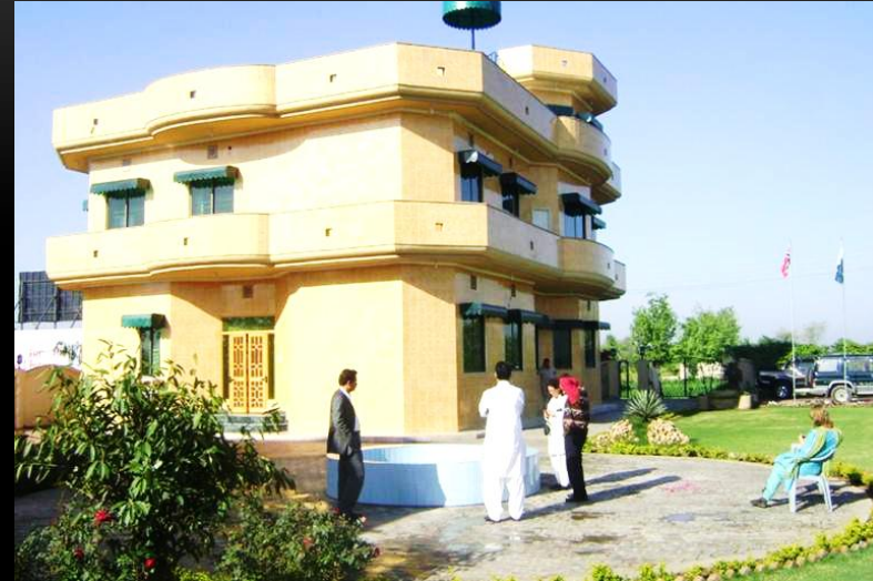
Ferdigstilt bygg 2009