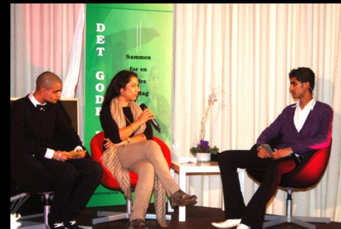
Dialog og samhandling