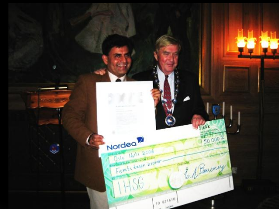
IHSG – vinnere av OXLO prisen m/ ordføreren