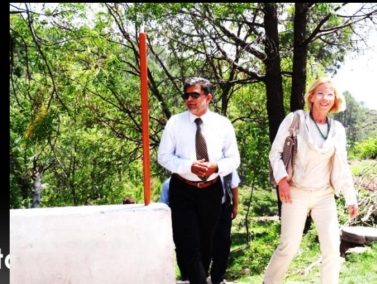
Besøk av Norges ambassadør 2012